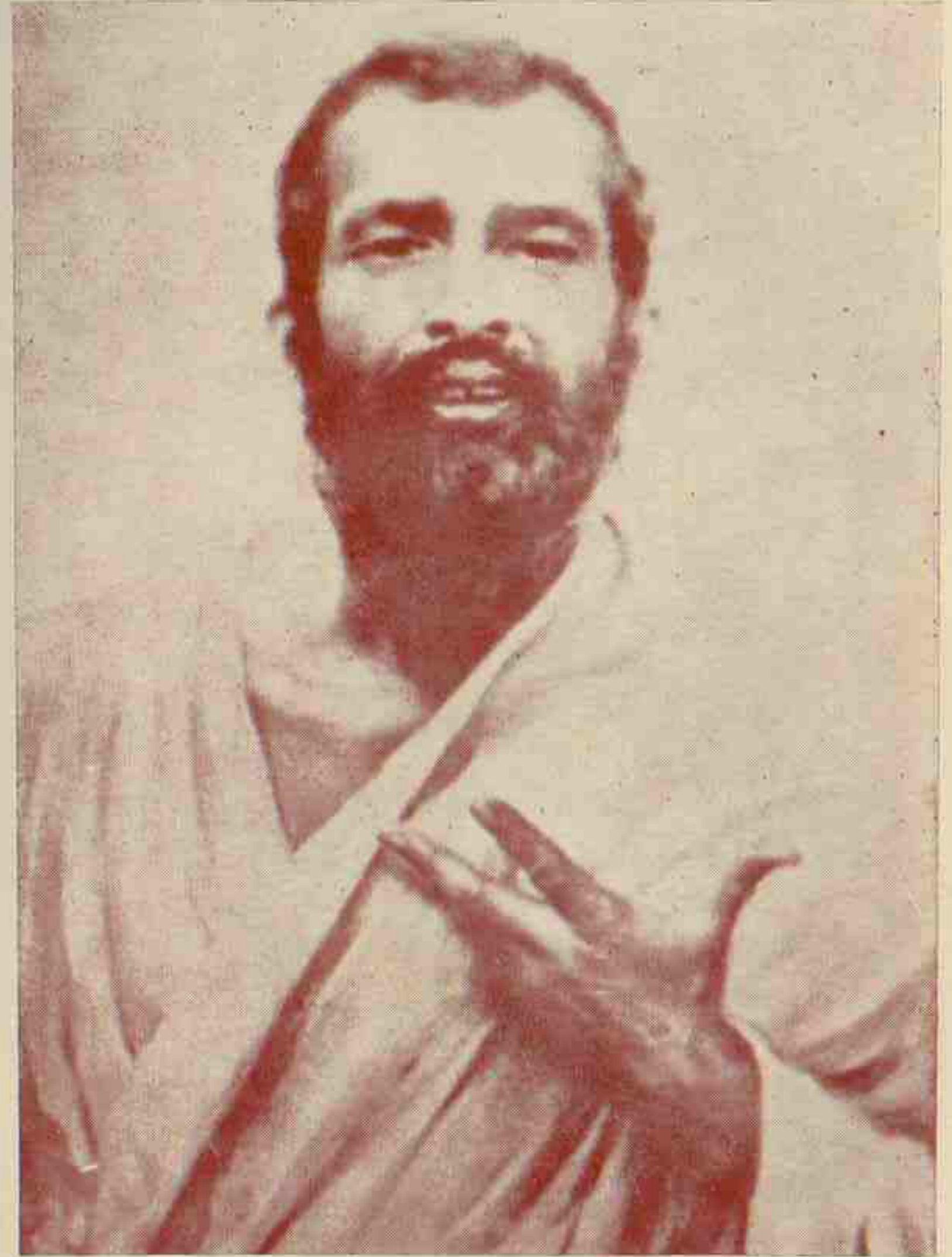
શ્રી. રામકૃષ્ણ પરમહંસ-ભાવ સમાધિમાં