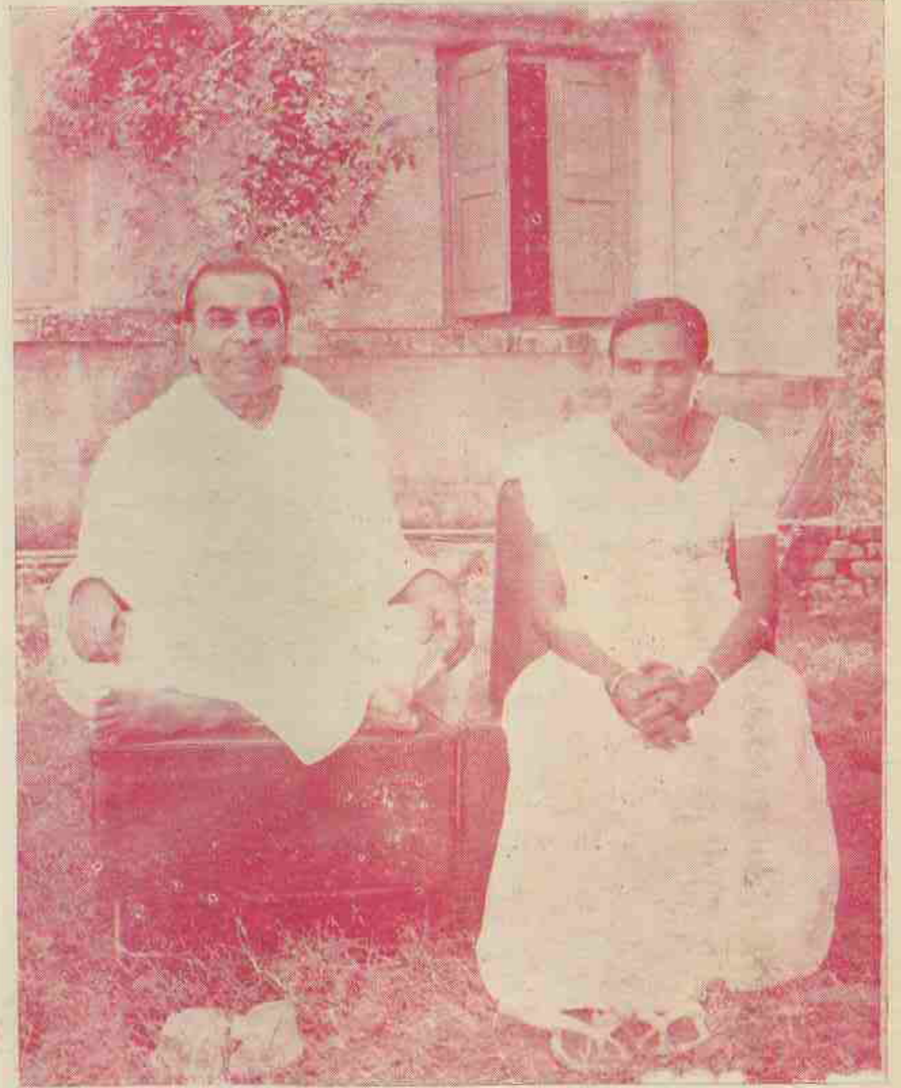
શ્રીયોગેશ્વરજી અને શ્રીસર્વેશ્વરી મા